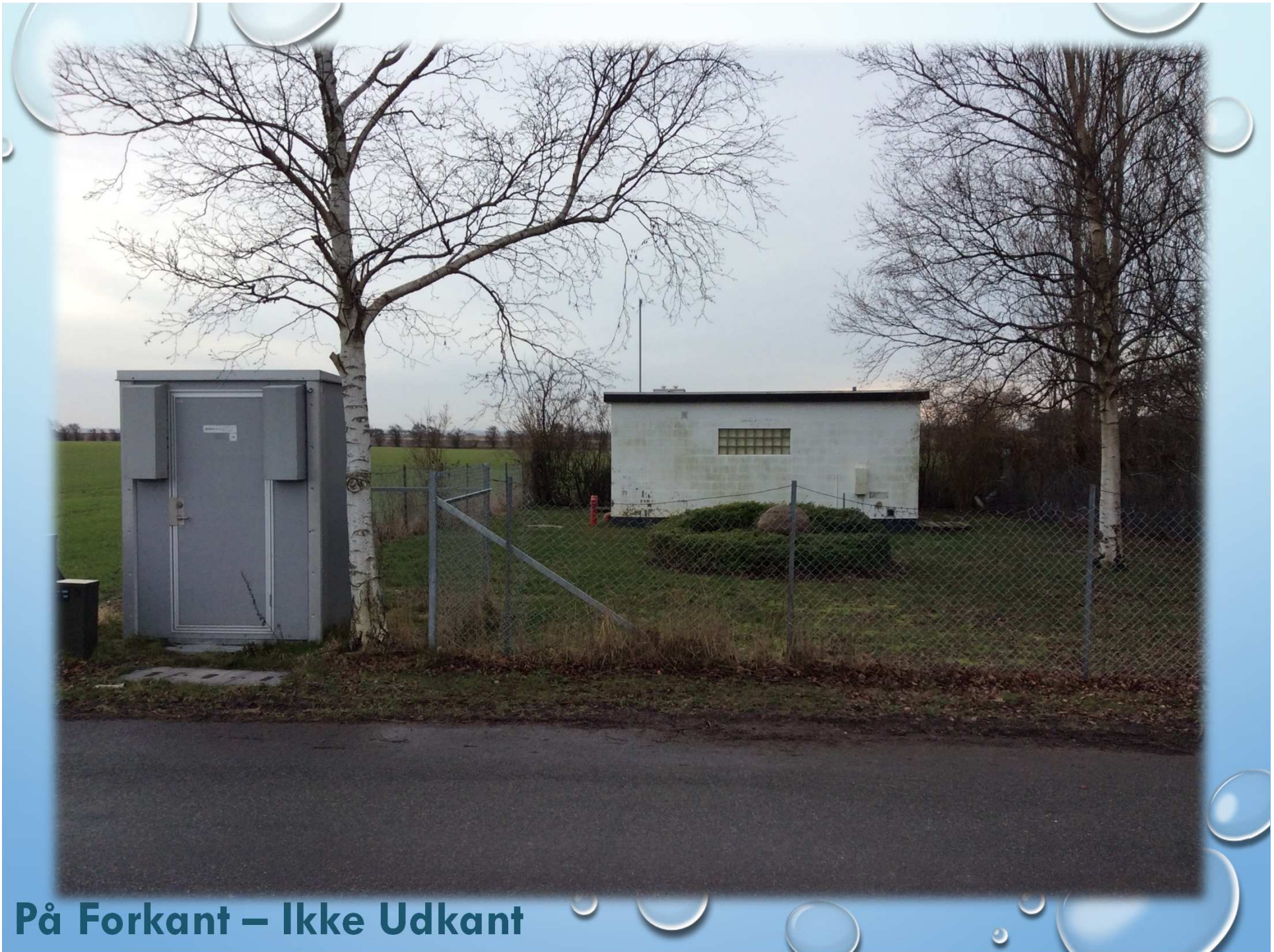
På Forkant – Ikke Udkant