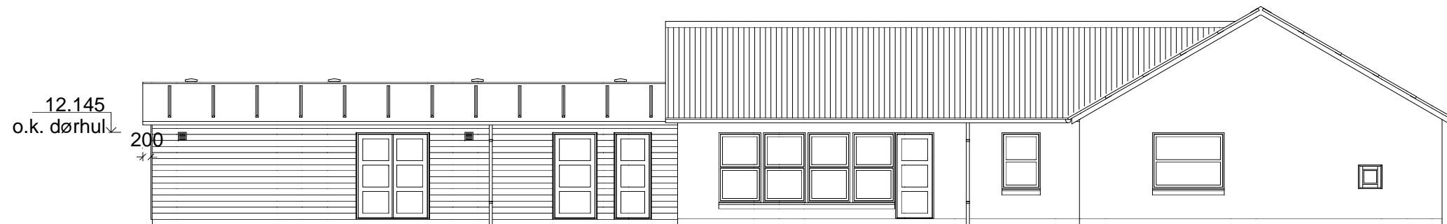
Facade mod øst.