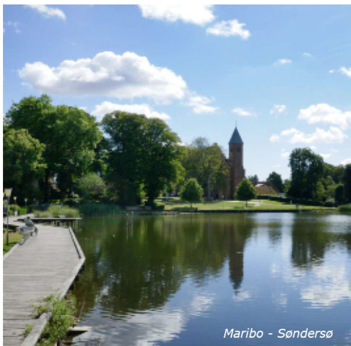
Maribo - Søndersø