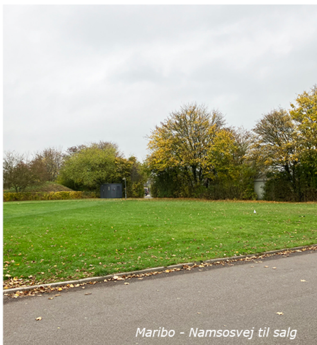
Maribo - Namsosvej til salg