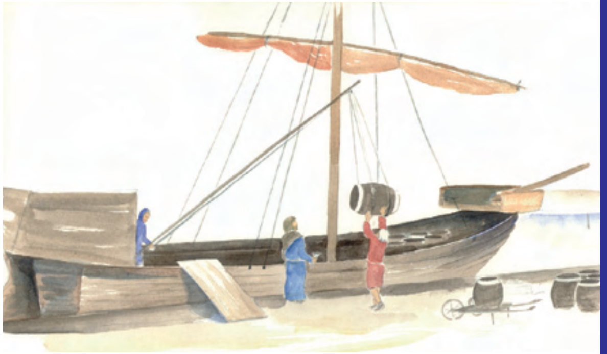
Skibsfart har altid spillet en stor rolle i Nakskov

Religionen var i middelalderen alfa og omega. Den var der, når barnet blev undfanget, født, voksede op, blev gift og i sidste ende døde. Troen var ikke rettet ene og alene på Gud og Jesus. I middelalderen var landet katolsk, hvilket bl.a. betyder, at man anså helgenerne som talerør til Gud. De kunne bringe bønner videre til himlen og formidle dem til den almægtige Gud. Der fandtes helgener for rigtig mange områder, f.eks. dem man bad til, når man havde tandpine, ønskede en god handel, skulle føde, rejse og mange andre områder. Det var ligeledes i religionen, man søgte støtte, trøst og svar i forbindelse