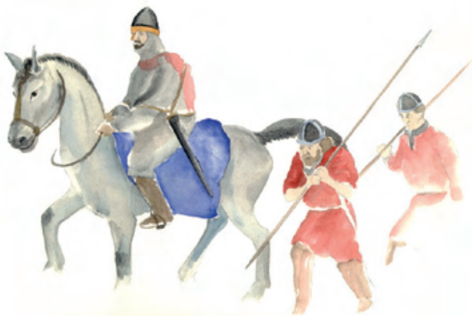
Rytter og fodfolk.

Dernæst var der byrådet, som var den daglige øverste magt i byen. Dette kunne bestå af et antal mænd, hvoraf mindst en blev valgt som borgmester (=borgernes mester).